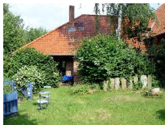
Ansicht von Norden 2003