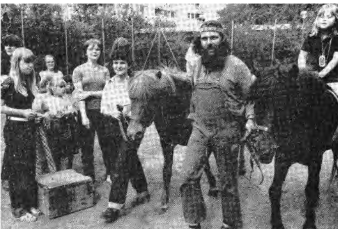
Ponyreiten beim Kinderfest in Detmerode

So waren die Ponys auch vor den Sommerferien beim Nachbarschaftsfest der „Neuland-Burg“ in Detmerode engagiert.