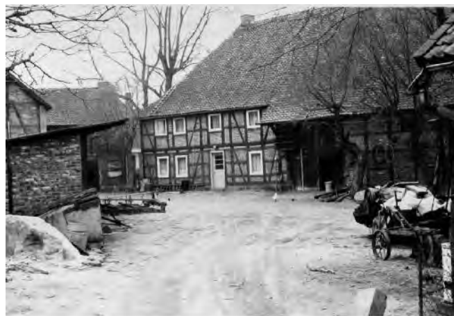
Ansicht von Süden 1973