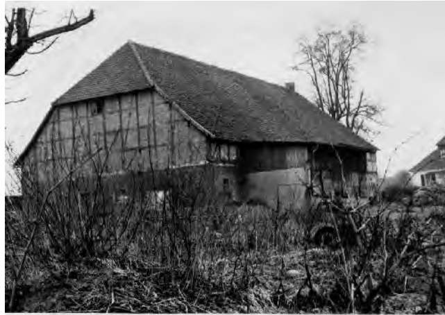
Ansicht von Osten 1973