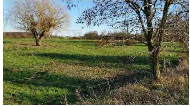
Renaturierung Müllkippe Dingelberg und „Schuttkuhle“ Lütjer Forthsberg