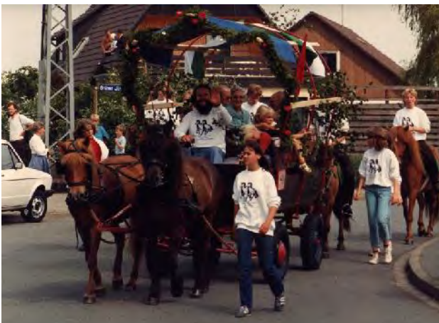
Kutsche fahren beim Schützenfest

Über 80 % der Vereinsmitglieder entstammen ursprünglich und Neumitglieder rekrutieren sich noch heute fast ausschließlich aus der Reitschule.