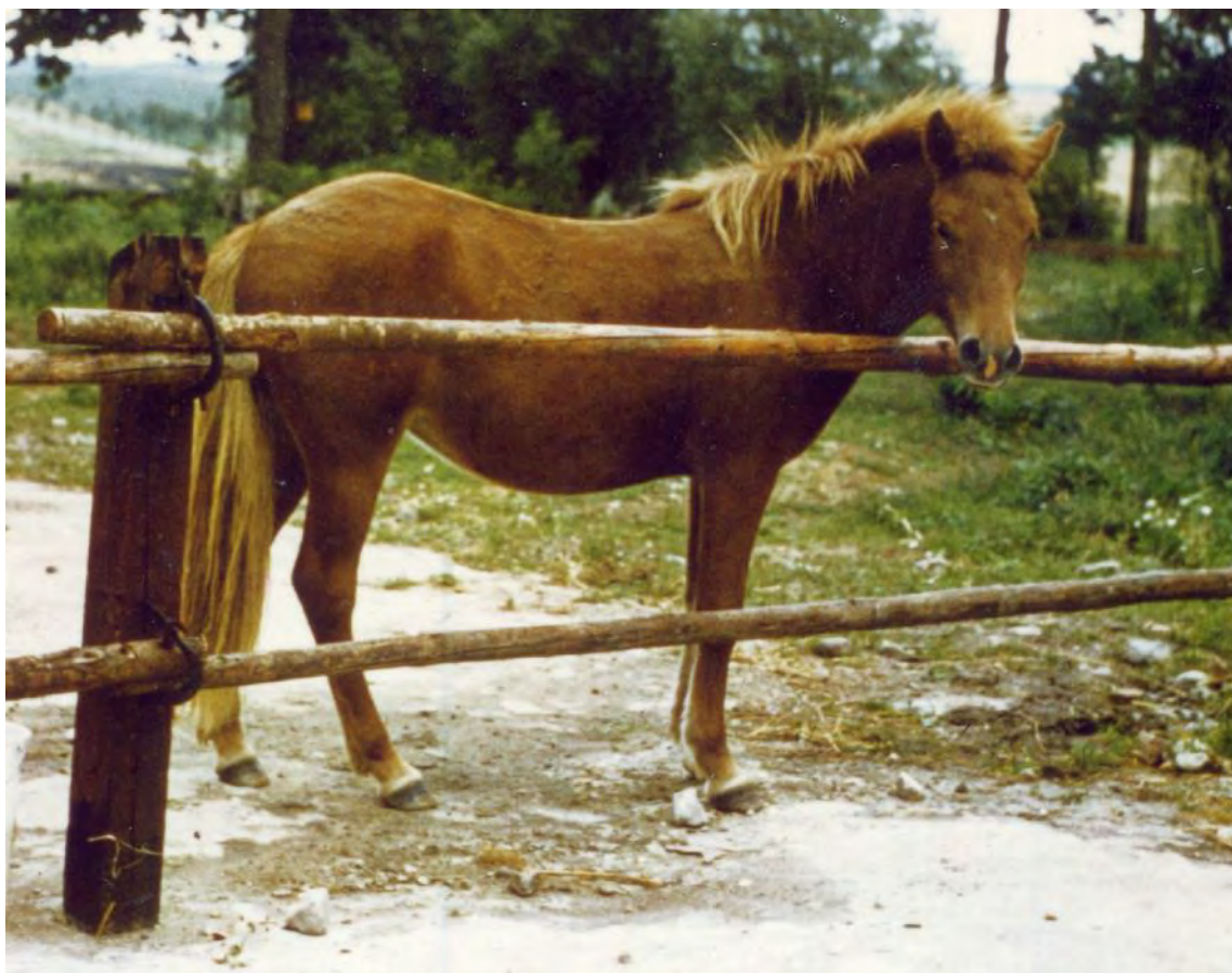
1974 Björk in ihrem Auslauf