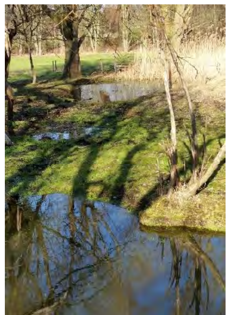
Anlage mehrerer Kleingewässer