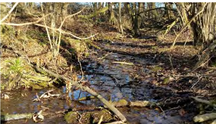
Kauf von Auwald mit Quelltopf im Kleywinkel

Pflanzung von Feldgehölzen im Rahmen einer Jahrgangprojektwoche mit 240 Schüler/innen meines 8. Jahrgangs der IGS