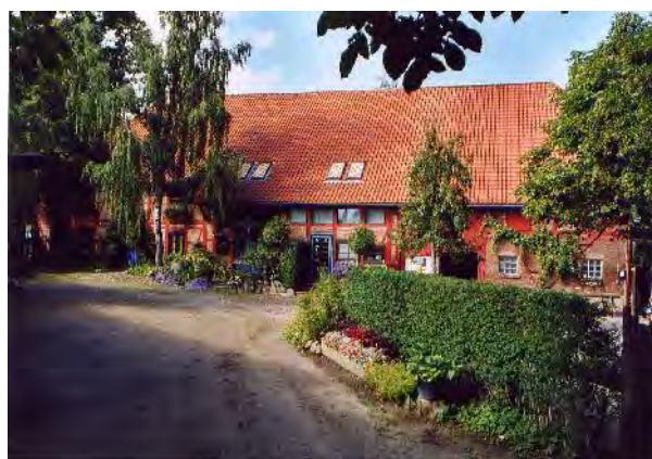
Ansicht von Süden 2003