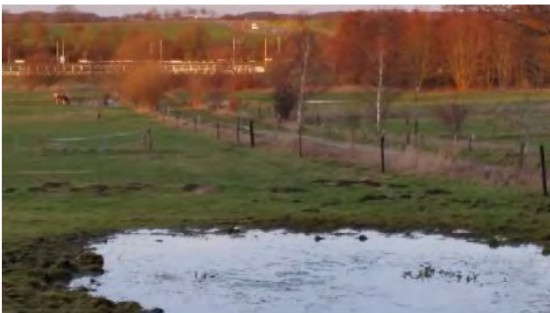
Parzellierung der Weiden und natürliche Ansiedlung von Feldgehölzen