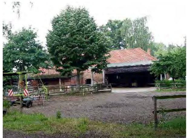
Ansicht von Osten 2003