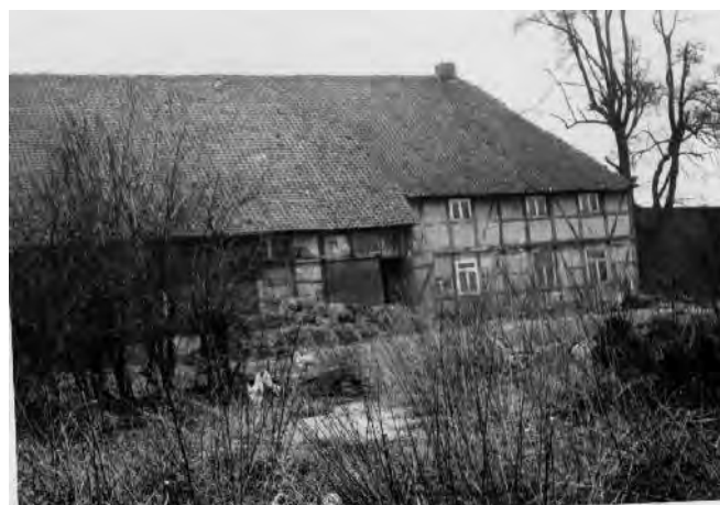
Ansicht von Norden 1973